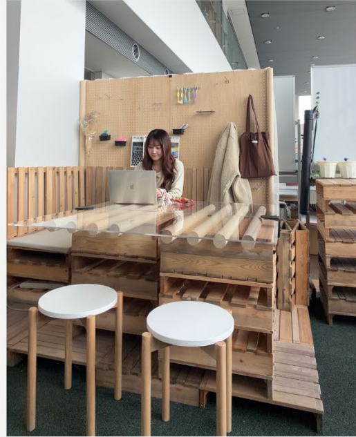
自然と視線が交わる配置