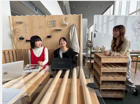
会話・交流生まれる