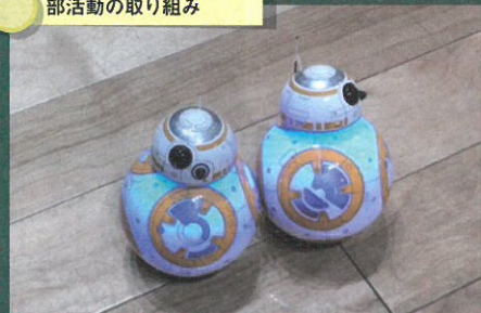
部活動の取り組み

部活動として「ロボットプログラミング部」で活動する児童たちは、音楽に合わせてロボット2台が一緒に踊るようにプログラミングを行う取り組みにも挑戦