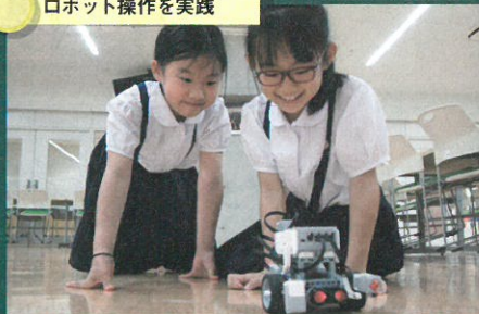
ロボット操作を実践

レゴブロックの教材キットで組み立てた小型ロボットとタブレット端末を使用し、進む・回転するなどの動作が書かれたブロックをつなげ、ロボットの動きを確認していく